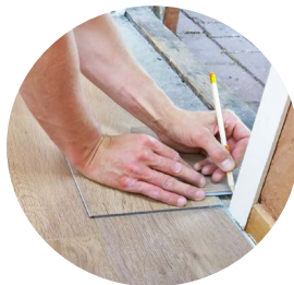
Aménagement, montage de meubles, petits travaux