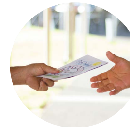
Campagnes de distribution et d'information