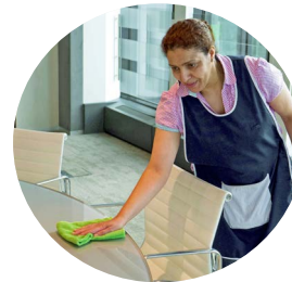
Distribution, service, nettoyage en restauration collective