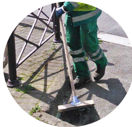
Entretien des espaces verts, propreté urbaine et gestion des déchets