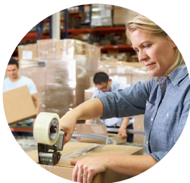
Petite manutention, portage, déménagement (panne d'ascenseur ou travaux en site occupé)