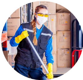
Nettoyage des locaux

- Entretien et facilitation du cadre de vie ou de travail de vos usagers, résidents, bénéficiaires ou collaborateurs. -